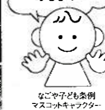
なごや子ども条例 マスコットキャラクター「なごっら」