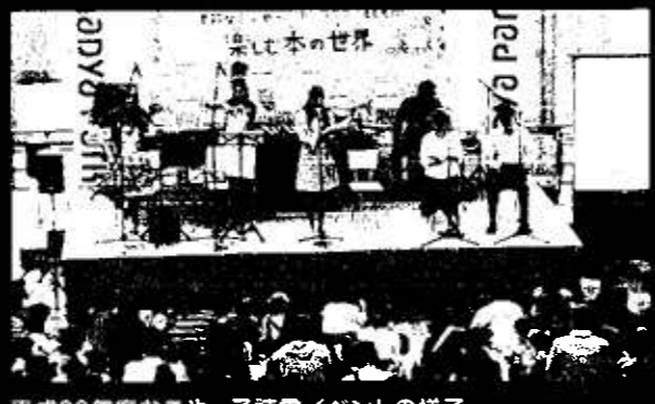
平成29年度なごやっ子読書イベントの様子